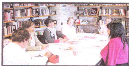
Un atelier d'écriture à La Bâtie

de La Bâtie-Montsaléon, Eourres, Lagrand, Laragne-Montéglin et Ribiers, cinq bibliothèques ont participé aux ateliers d'écriture dont l'aboutissement est la publication d'un recueil de textes que vous pourrez emprunter à votre bibliothèque municipale. Pour présenter ces écrits et les mettre en valeur, un spectacle par la Compagnie Tara-kaïka a eu lieu vendredi 3 décembre à la Bibliothèque de Lagrand.