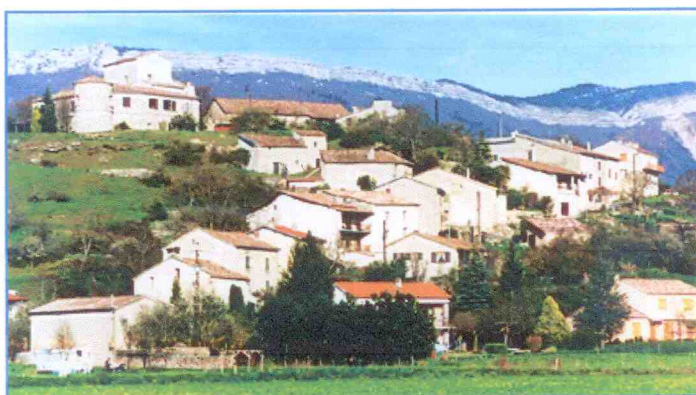
La Bâtie, vue depuis la place de la Mairie